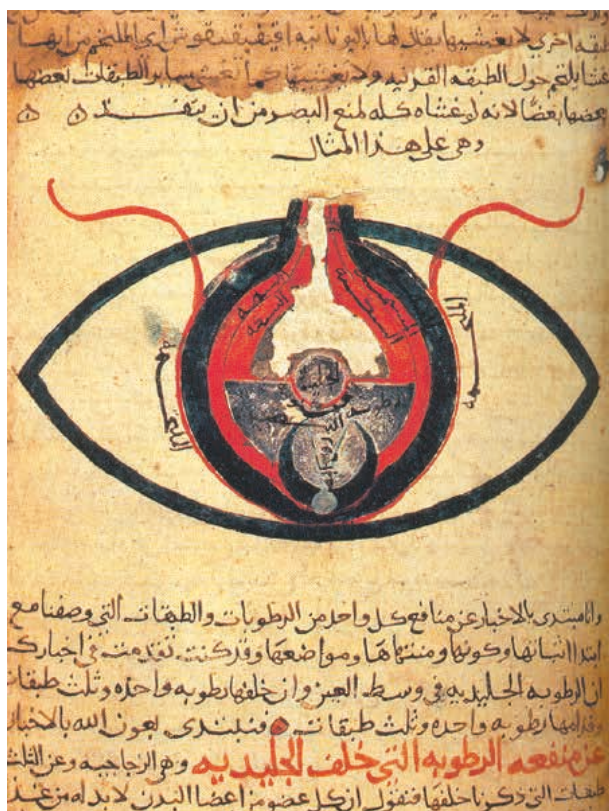
L'œil selon Hunain ibn Ishaq. Cheshm manuscrit, daté de 1200 ans environ. Bibliothèque nationale du Caire

Cette période de confrontation est aussi la période où l'Islam, ses textes, son histoire commencent à être compris et lus dans le texte par des intellectuels chrétiens occidentaux, pas seulement en Espagne. C'est un mouvement qui donnera quelques siècles plus tard naissance aux sciences orientalistes.