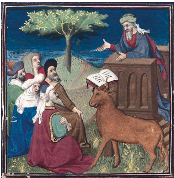
Mahomet prêchant illustré par le Maître de Rohan et collab. Boccace, De casibus, Paris, 1er quart du XVe siècle.

Pour essayer de faire une place à l'islam dans l'histoire du salut, les chrétiens d'Occident vont le considérer comme une hérésie chrétienne, une déviation du christianisme. Ils ne sont pas les premiers à penser ainsi. Cette idée se maintient également longtemps dans la représentation que l'Europe se fait de la religion musulmane.